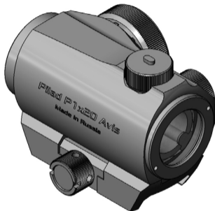
Рисунок А2 – Внешний вид прицела P1x20 Avis