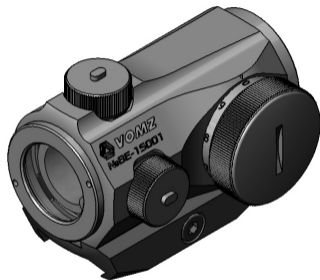
Рисунок А3 – Внешний вид прицела P1x20 Avis-military